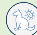
Acarions ou poils d'animaux