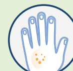
La dermatite atopique, l'eczéma