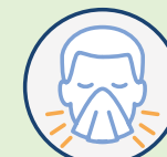
Le rhume des foins (rhinite allergique)