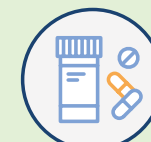
L'allergie aux médicaments