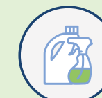
Latex & produits chimiques