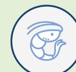
Les allergies alimentaires