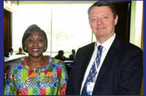
Raymonde Goudou-Coffie, ministre de la Santé et de l'Hygiène publique de Côte d'Ivoire et Philippe Lamoureux.