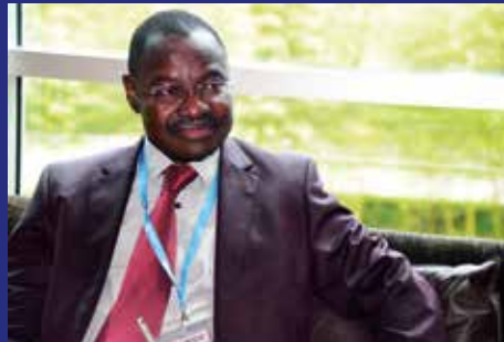
Pr Moustapha Mijiyawa, ministre de la Santé et de la Protection sociale du Togo.