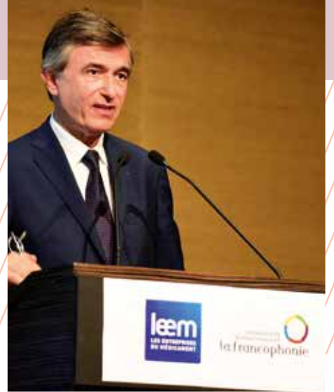
Pr Philippe DOUSTE-BLAZY président d'UNITAID FRANCE