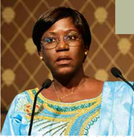
Marie-Madeleine TOGO Ministre de la Santé et de l'Hygiène publique MALI