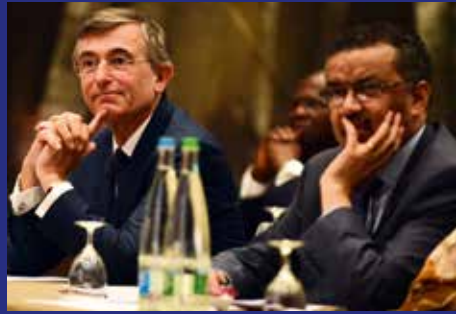
Le Pr Philippe Douste-Blazy, président d'UNITAID et le Dr Tedros Adhanom Ghebreyesus, ministre des Affaires Étrangères d'Éthiopie.