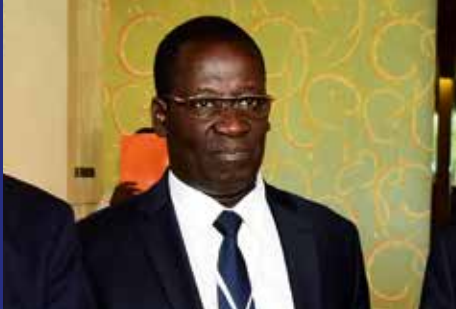
Dr Alassane Seidou, ministre de la Santé du Bénin.