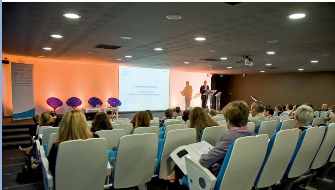
> Colloque Fondation / juin 2011